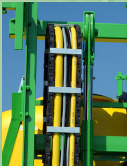
Zentrale Schlauchführung im Hubmast über eine Gliederkette

Das neue Gestängeprofil für lange Lebensdauer, zeichnet sich durch optimalen Schutz von Mehrbereichsdüsen aus und die Schwingungseigenschaften wurden noch weiter verbessert. Auch zur Ausbringung von Flüssigdünger sehr gut geeignet.