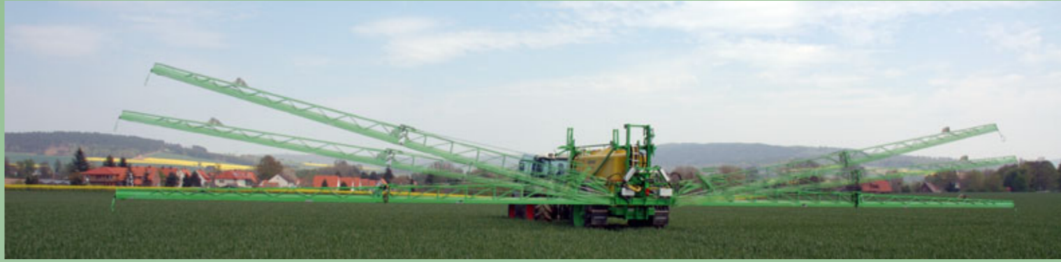
Gestängeanwinklung - zur optimalen Höhenanpassung im kopierten Gelände