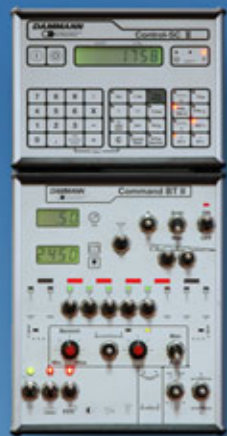
SRAY-Control S & Bedienteil II

Individuelle Technik - verschiedene Bedienteile und Computer, für Ihre spezielle Betriebsstruktur.