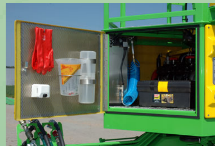
Geschützter Armaturraum mit Stauraum für Zubehör