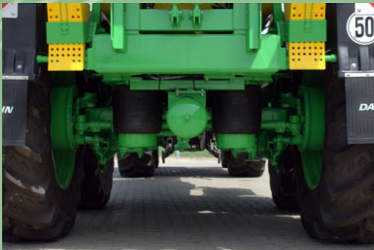
Tandemachse mit pneumatischer Federung (Serienausstattung)

Die hintere Achse ist eine Nachlaufachse, daher entstehen beim Wenden trotz Tandemfahrwerk keine zusätzlichen Spuren und Radierungen. Lieferbare Spurbreiten 1900 mm bis 2250 mm. Hohe Bodenfreiheit bis 70 cm je nach Bereifung.