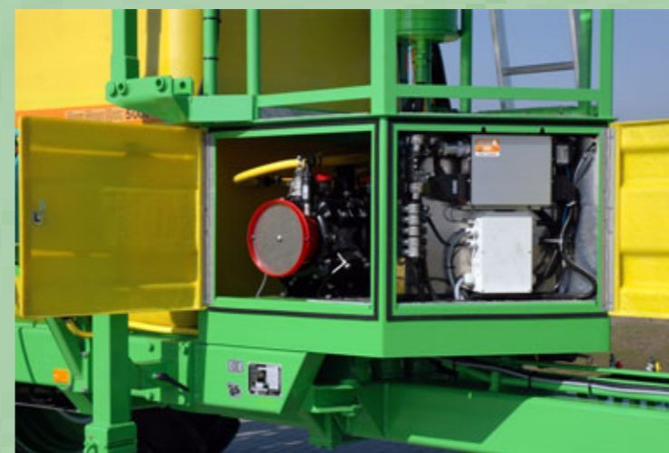
Alle wichtigen Teile, wie elektrische Steuerung, Armatur, Pumpe sind gegen äußere Einflüsse geschützt