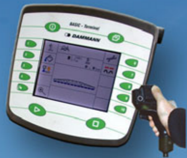
BASIC-Terminal & BASIC - Terminal TOP