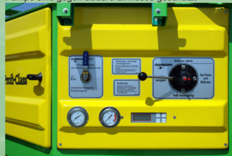
Übersichtliche und leichte Bedienung über Zentralhähe