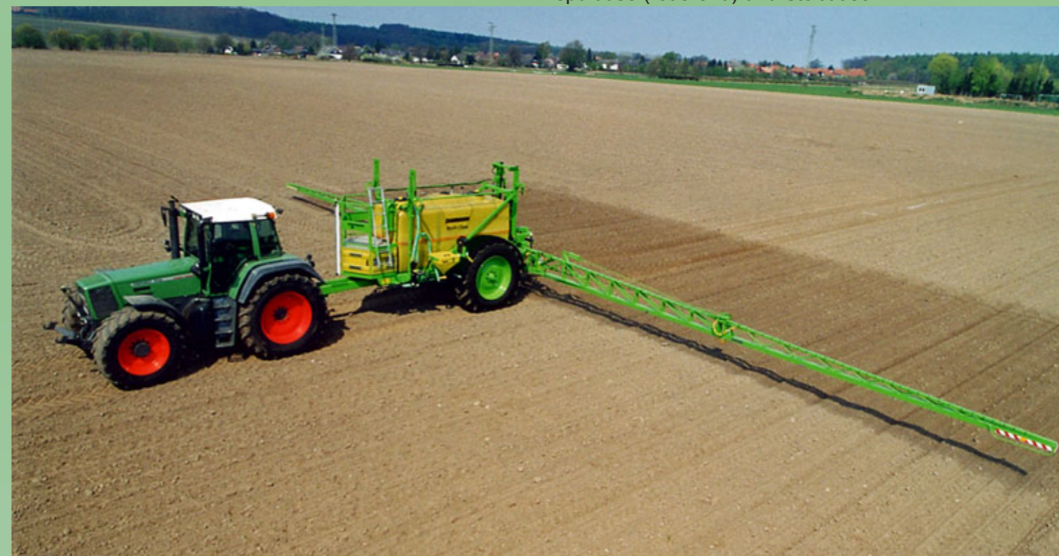
Pneumatische Flüssigkeitssteuerung direkt an der Düse, mit einer integrierten Druckumlaufspülung, sorgt für eine fachgerechte und umweltfreundliche Applikation. (Der Wirkstoff befindet sich vom Start an, direkt an der Düse)