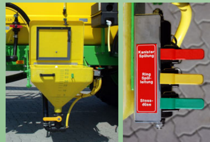
Mitteinspülschleuse 60 l mit Ringspüleleitung, Kanister-spüldüse (rotierend) und Stoßdüse.