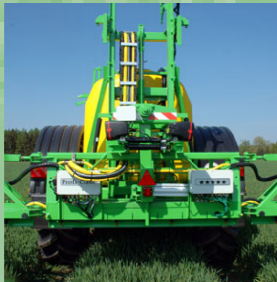
Gestängeaufhängung. Das Maß aller Dinge für höchste Stabilität und optimalste Gestängelage. Die Grundvoraussetzung für idealste Applikation.